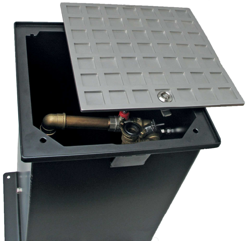
Edelstahl Schachtdeckel mit Edelstahl 3kt-Schloß